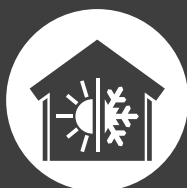
I.T.E. / PSE