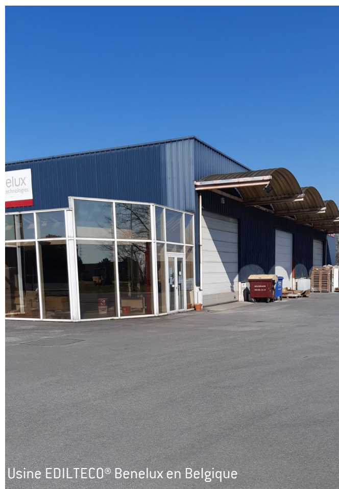
Usine EDILTECO® Benelux en Belgique

- Le POLITERM® Fein c'est un agrégat idéal pour élaborer des variétés de formules de chapes, mortiers et bétons légers thermo-acoustiques de densité allant de 200 à 1800 kg/m 3 . Cette gamme englobe le POLITERM® Fein (diamètre de la bille 2 - 3 mm) et le POLITERM® (diamètre de la bille 4 - 6 mm).